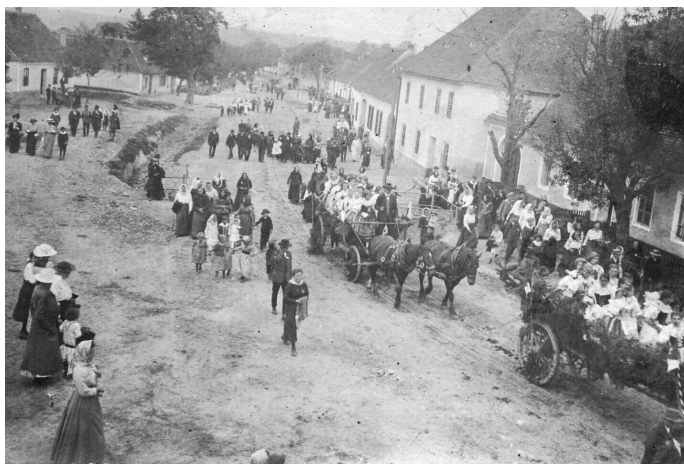
Přívod o dožínkách na počátku minulého století