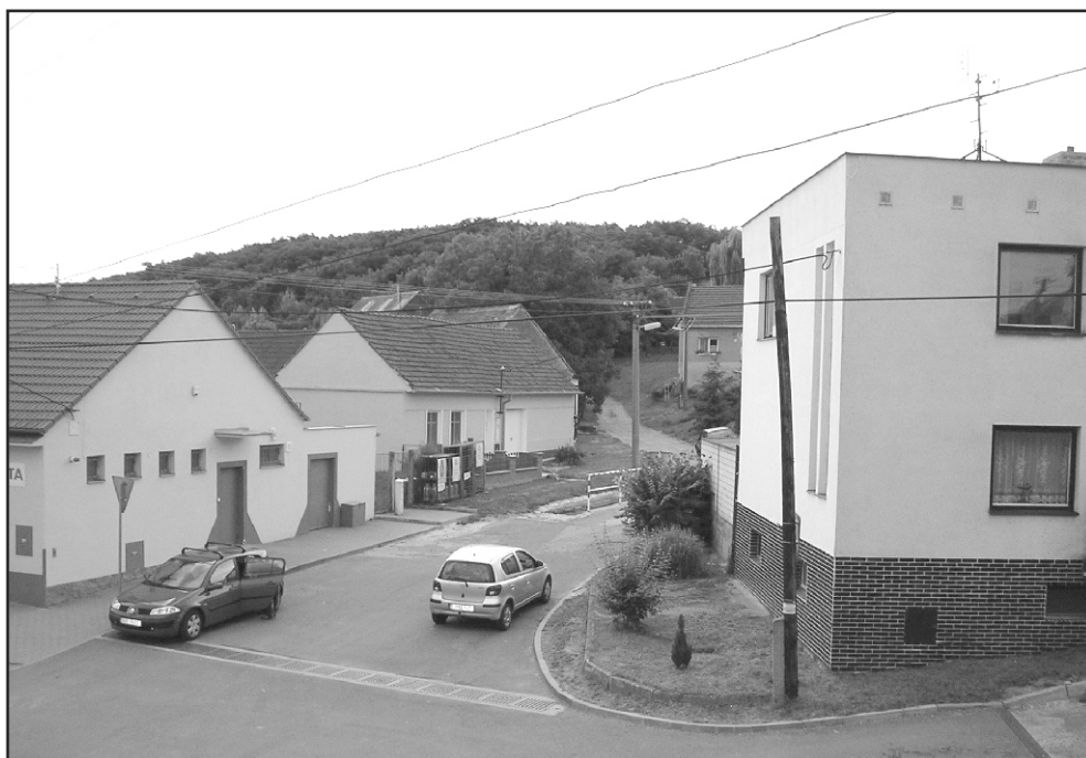
...a dnešní stav