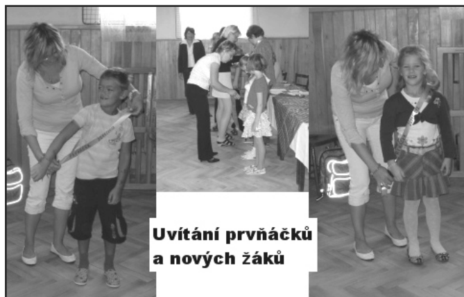
Uvítání prvňáčků a nových žáků

V pátek 24. 6. 2011 oslavila Základní škola ve Vémyslicích již 85. narozeniny. Po náročných přípravách byl tento den věnován tomuto slavnostnímu výročí. Dopoledne žáci připravili třídy na odpolední den otevřených dveří, vytvořili prezentace, připravili country kavárnu, tak trochu ve stylu country se letošní oslavy nesly, a nachystali drobné občerstvení pro odpolední hosty z řad veřejnosti. Ta se nedala zahanbit a návštěvníků, kteří přišli zavzpomínat na dávná školní léta, nebo si prohlédnout, co se od doby jejich poslední návštěvy změnilo, se sešlo opravdu početně. Pro všechny pedagogické a provozní zaměstnance, ať už bývalé či současné, starosty a zástupce obcí, hosty připravila v rámci spolupráce své gastronomickými výrobky a slavnostní tabuli SOŠ obchodní a SOU řemesel